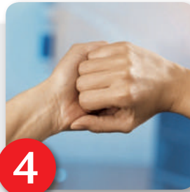
Schritt 4 Außenseite der Finger auf gegenüberliegende Handflächen mit verschränkten Fingern