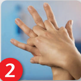
Schritt 2 Rechte Handfläche über linkem Handrücken und linke Handfläche über rechtem Handrücken