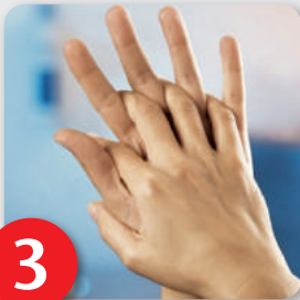
Schritt 3 Handfläche auf Handfläche mit verschränkten gespreizten Fingern