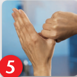
Schritt 5 Kreisendes Reiben des linken Daumens in der geschlossenen rechten Handfläche und umgekehrt