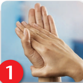
Schritt 1 Handfläche auf Handfläche